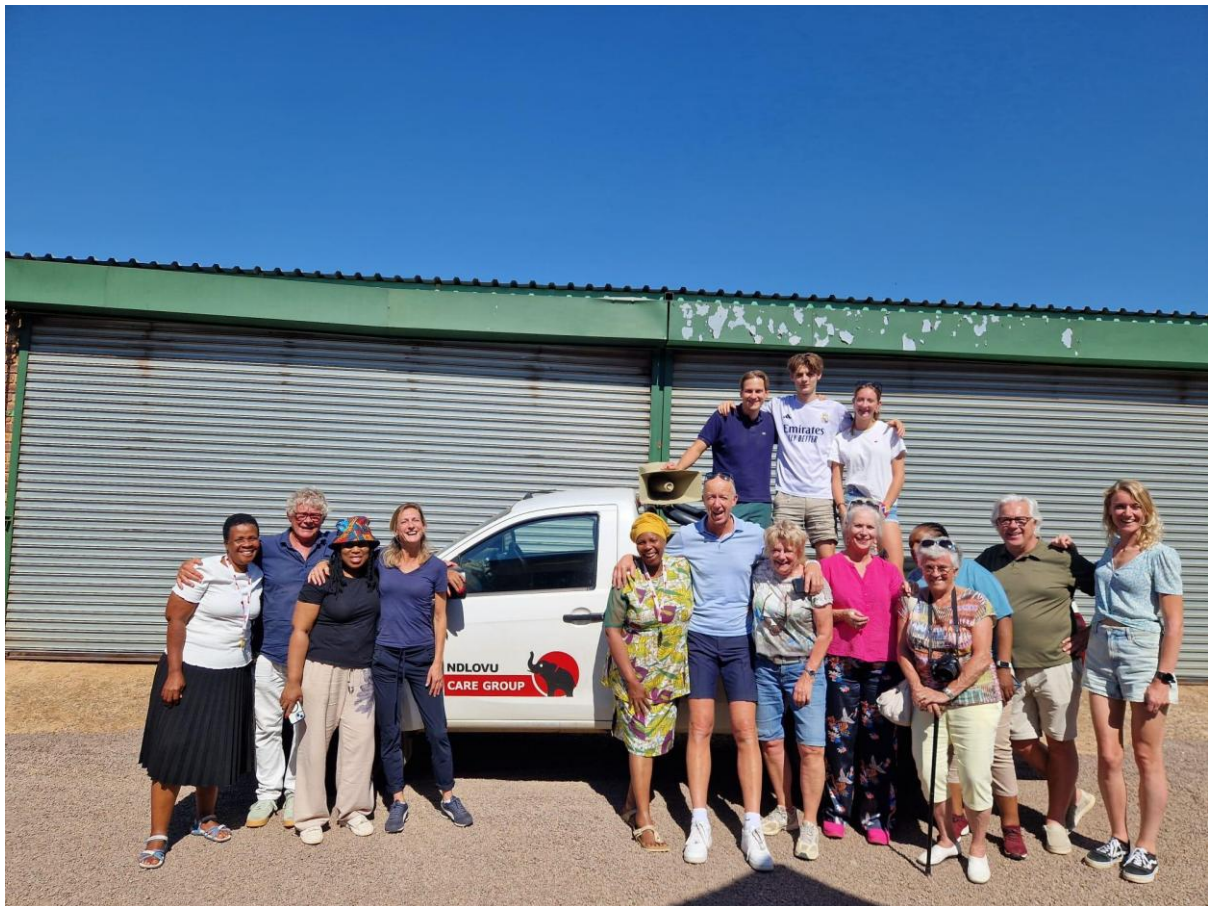
Groepsfoto tijdens de Tjommie Experience 2025.