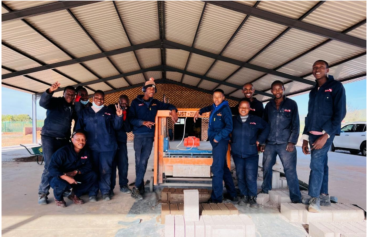
Begunstigen van het disability project – nu ook in staat om inkomsten te genereren in het bakstenenproject.