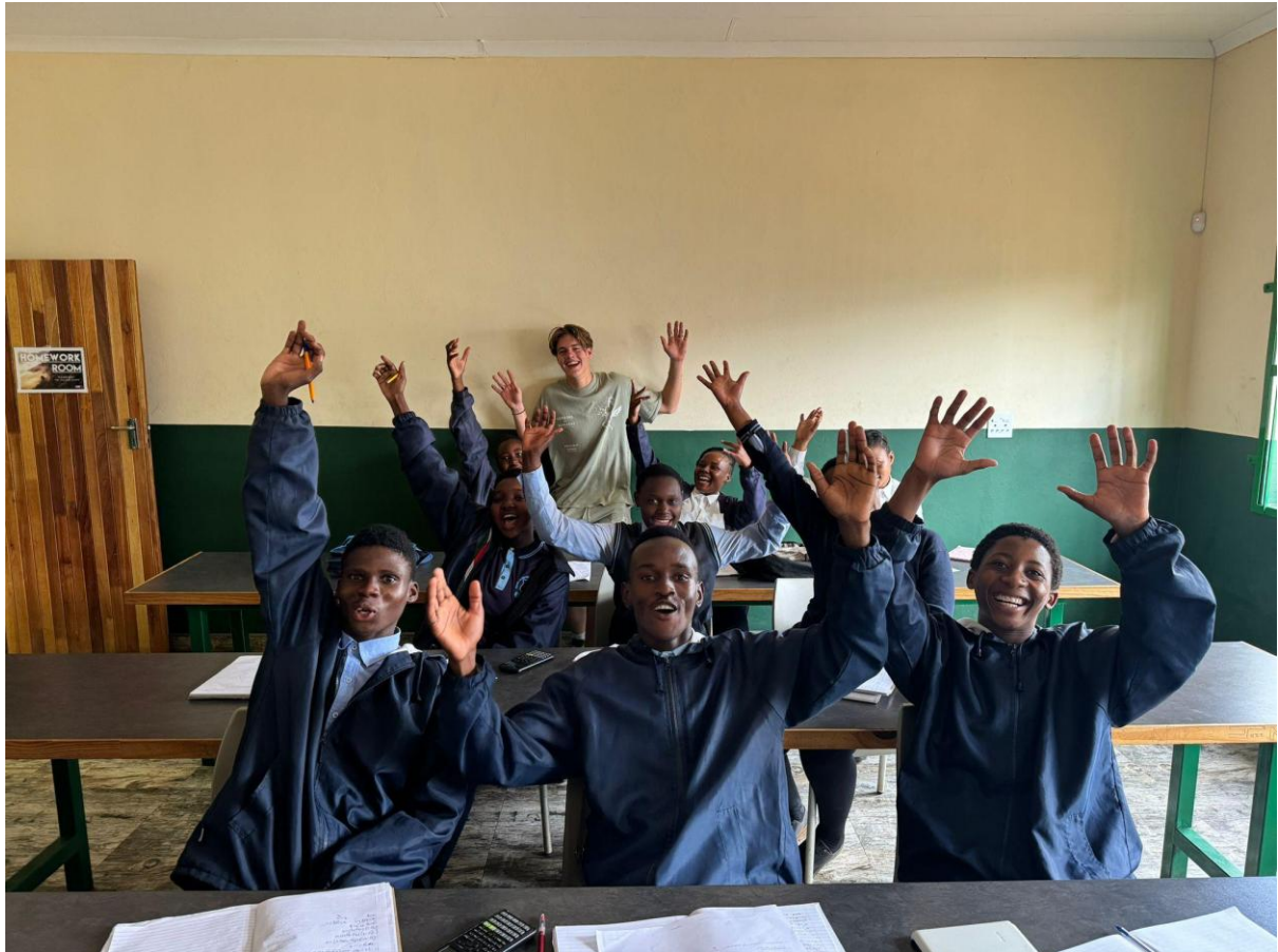
Bezoek aan de ambachtsschool tijdens de Tjommie Experience 2024.