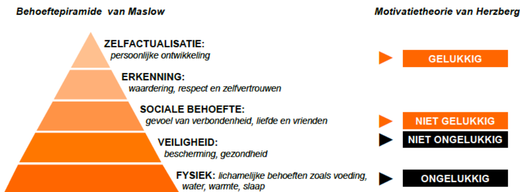
Figuur 2. De behoeftepiramide van Maslow aangevuld met de motivatietheorie van Herzberg

Het Kinderprogramma van Ndlovu Care Group is gebaseerd op het Development Goals Report 2021 van de Zuid-Afrikaanse overheid. De diverse programmaonderdelen spelen in op de uiteenlopende problemen van kinderen en jongeren in townships. Kenmerkend hiervoor is de integrale aanpak. Daarbij wordt gekeken naar alle aspecten van het dagelijks leven van het kind, zodat het in elke levensfase - van kind tot jong volwassene - passende begeleiding krijgt. Deze holistische aanpak is gebaseerd op de behoeftepiramide van Maslow, aangevuld met de motivatietheorie van Herzberg, en neemt de basisbehoeften van het kind als startpunt. Alleen als deze vervuld zijn, kan het kind zich op andere niveaus ontwikkelen. Wanneer een 'sense of belonging', zelfvertrouwen en zelfactualisatie ontstaan, kan het kind van ongelukkig naar gelukkig groeien en de vicieuze armoedecirkel doorbreken. Zie ook figuur 2.