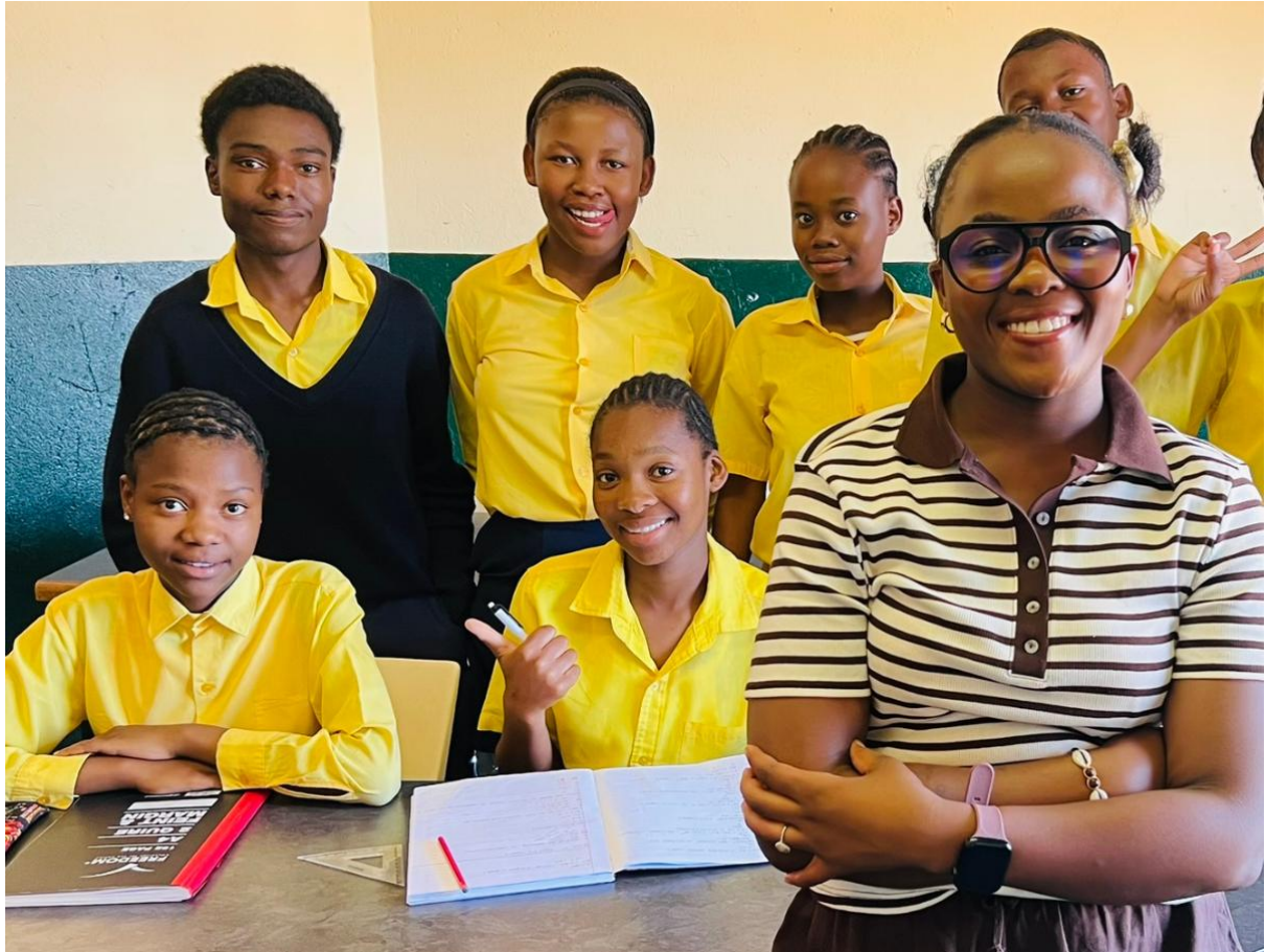
Begunstigden van het After School Program met hun lerares.

De verschillende programma's bieden kinderen en jongeren een stabiele omgeving waarin zij leren omgaan met trauma en tegenslag. Door begeleiding, onderwijs, sport en gerichte ondersteuning werken we aan hun veerkracht, zelfvertrouwen en toekomstperspectief. Zo begeleiden we hen stap voor stap naar gezonde, weerbare en verantwoordelijke jongvolwassenen die actief kunnen bijdragen aan hun gemeenschap.