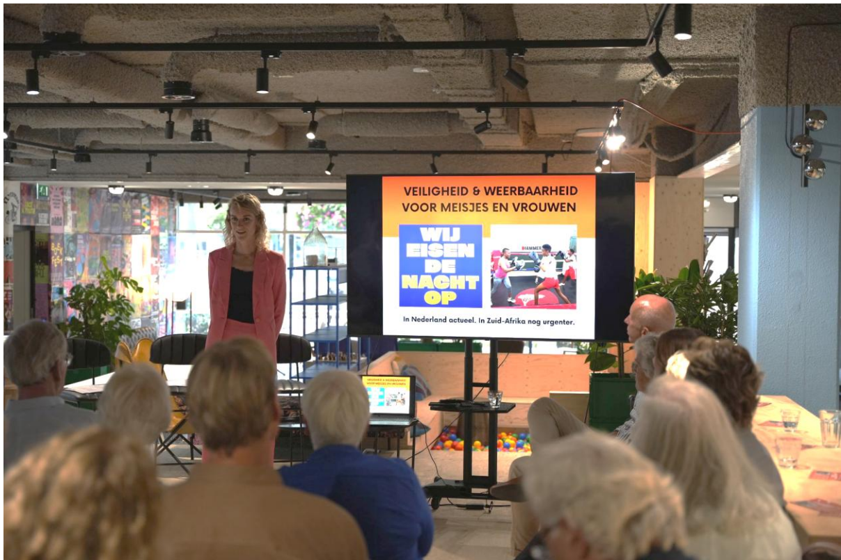
Tjommie Meet-Up 2025.